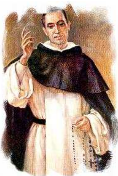
Francesc Coll i Guitart

Propera canonització dels beats Francesc Coll i Guitart (18-5-1812, Grombrèn, Girona – 2.4.1875, Vic), fundador de la Congregació de les Germanes Dominiques de l'Anunciata, i de Rafael Arnáiz Baró (9.4.1911, Burgos – 26.4.1938, Dueñas).