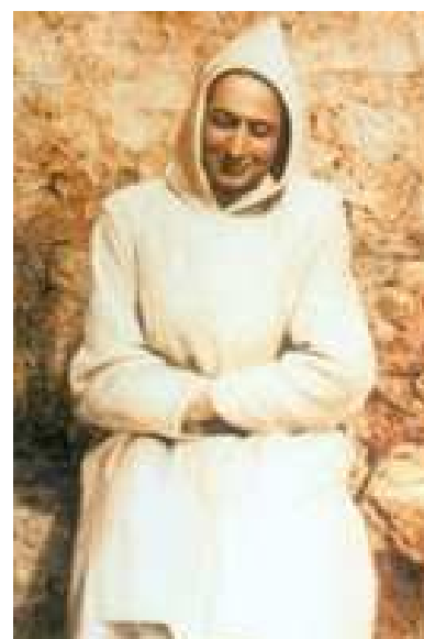
Rafael Arnáiz Baró

El Papa va autoritzar el matí del 6 de desembre la promulgació dels decrets de reconeixement dels miracles atribuïts a la intercessió dels dos beats, cosa que permet la seva inclusió al catàleg de sants de l'Església universal. Falta l'especificació, per part de la Santa Seu, de la data en què el Sant Pare celebrarà aquestes canonitzacions.