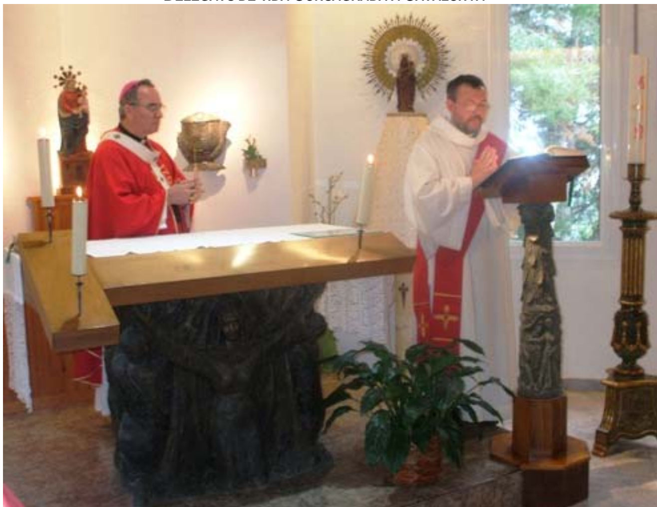
SANTUARI DE LORETO, 5.06.2009

Molt estimats germans i germanes en el Senyor. Sigueu benvinguts els delegats de la vida consagrada a Catalunya.