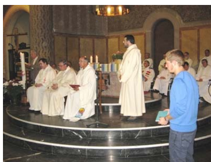
L'Eucaristia concelebrada fou presidida per l'abat de Montserrat. Moment de les ofrenes