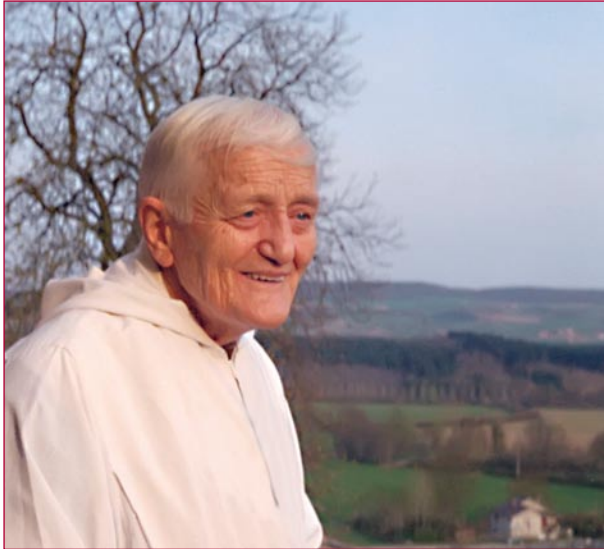
El germà Roger Schutz, fundador de la Comunitat de Taizé