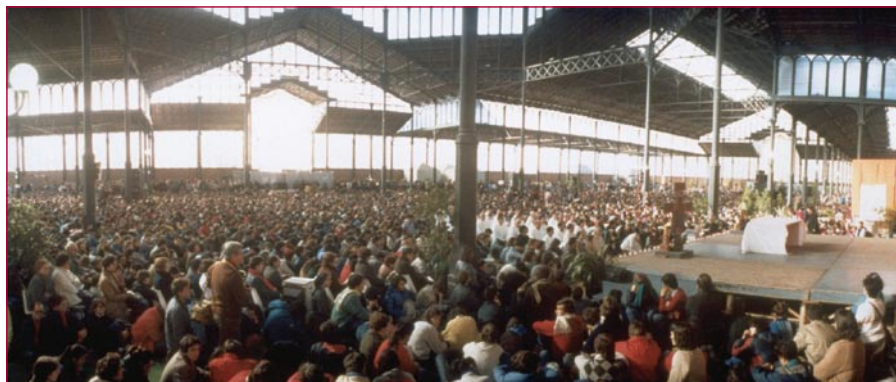
Trobada europea a Barcelona l'any 1985, pregària al Born