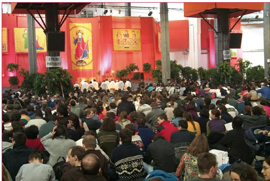
Trobada europea a Barcelona l'any 2000, pregària a la Fira de Montjuïc