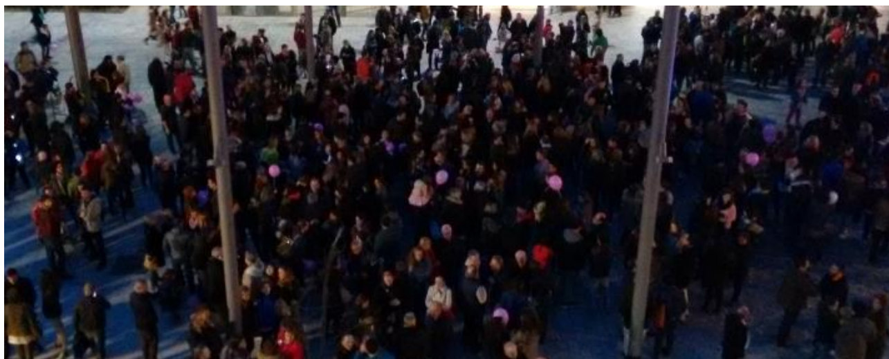
Concentració contra els abusos i de suport als maristes a la Plaça de Sants